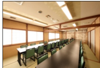
店内の様子 (110席まで対応可)

真心込めた料理を提供いたしますのでお気軽にご連絡下さい」と笑顔で語って下さいました。